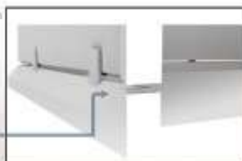
Rail périphérique moulé du receveur