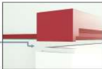
Section d'emboîtement de la plage